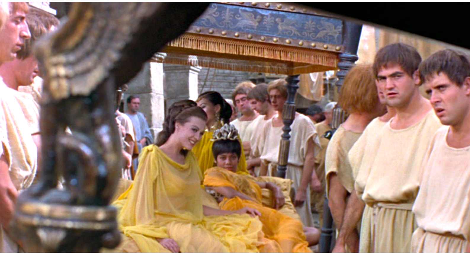
Scène de rue ( Le Forum en Folie de Richard Lester)