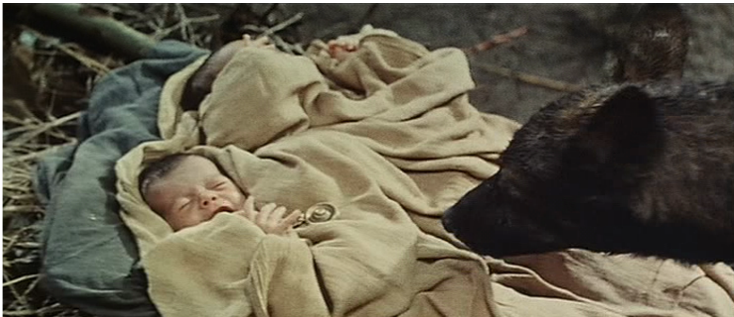
La louve se penche sur Romulus et Rémus ( Romulus et Rémus , Sergio Corbucci, 1961)

quaedam nomine " Leaena " cum tyrannum occidisset, quia nefas erat simulacrum constitui meretricis in templo, animalis effigiem posuerunt cuius nomen gerebat. [4] Itaque ut illi monumentum ex nomine, sic isti ex professione fecerunt. Huius nomini etiam dies festus dicatus est et " Larentinalia " constituta.