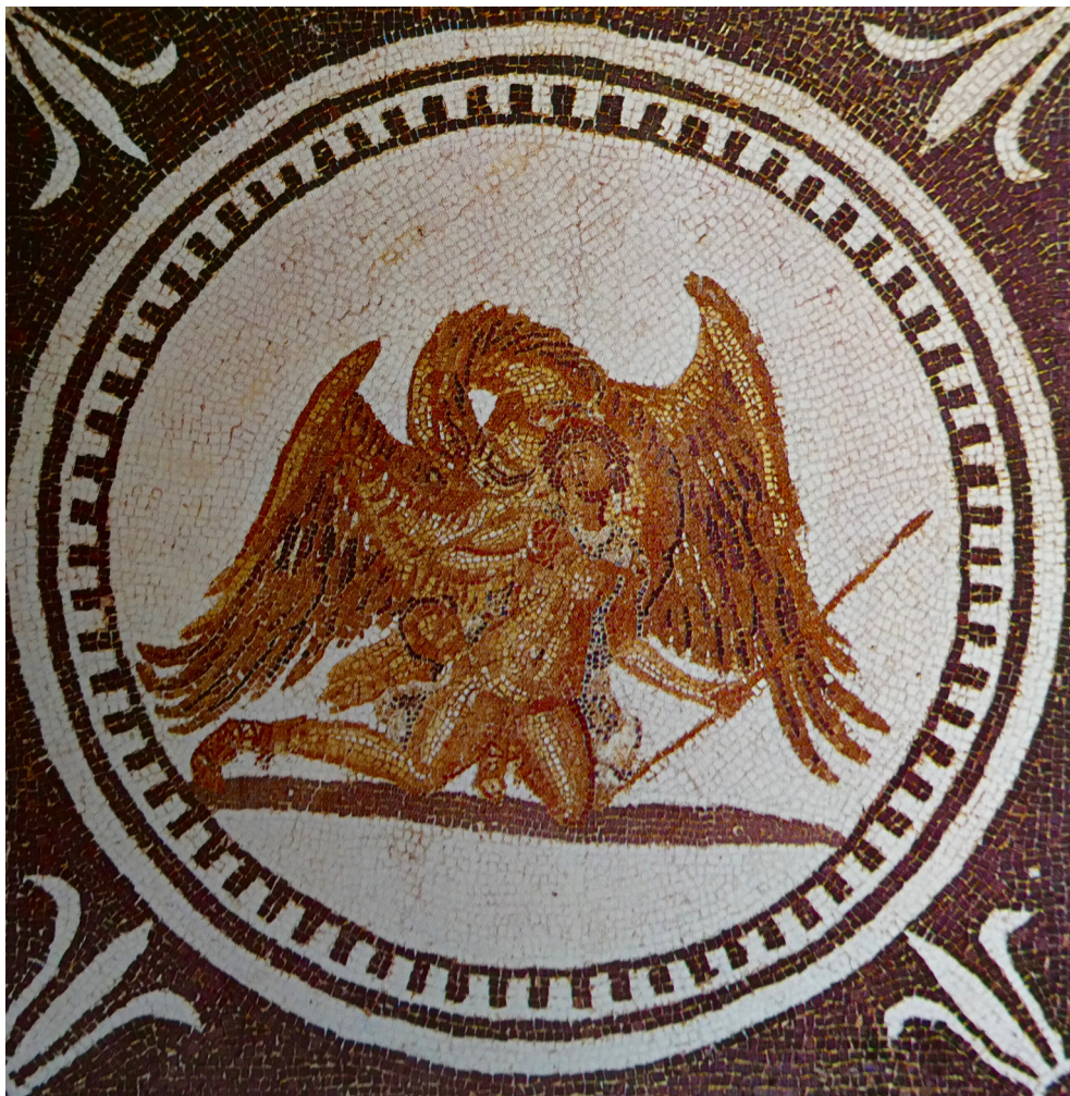
L'aigle de Jupiter enlève Ganymède ( mosaïque de Sousse/musée du Bardo/Tunisie)

[62] [...] Qui quomodo potuerit argumentari, ostendi. Nunc dicam quomodo, ubi, a quo sit hoc factum : non enim Saturnus hoc, sed Iuppiter fecit. [63] In Sacra Historia sic Ennius tradit : "Deinde Pan eum deducit in montem, qui vocatur Caeli Stella. Postquam eo ascendit, contemplatus est late terras ibique eo in monte aram creat Caelo, primusque in ea ara Iupiter sacrificavit. In eo loco suspexit in caelum quod nunc nos nominamus, eique quod supra mundum erat, quod aether vocabatur, de sui avi nomine Caelum nomen indidit, idque Iuppiter quod aether vocatur placans primus Caelum nominavit eamque hostiam quam ibi sacrificavit totam adolevit ." Nec hic tantum sacrificasse Iuppiter invenitur. [64] Caesar quoque in Arato refert Aglaosthenem dicere, "Iovem cum ex insula Naxo adversus Titanas proficisceretur et sacrificium faceret in litore, aquilam ei in auspiciu advolasse, quam victor bono omine acceptam tutelae suae subiugarit ." [65] Sacra vero Historia etiam "ante consedisse illi aquilam in capite atque ei regnum portendisse " testatur. Cui ergo sacrificare Iuppiter potuit nisi Caelo avo ?