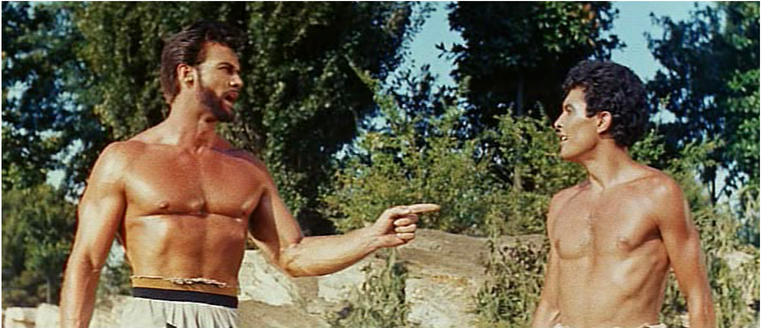
Hercule et Ulysse ( Les Travaux d'Hercule , Pietro Francisci, 1958)

[1] Hoc loco refellendi sunt etiam ii qui deos ex hominibus esse factos non tantum fatentur, sed, ut eos laudent, etiam gloriantur, aut virtutis gratia, ut Herculem, aut munerum , ut Cererem ac Liberum, aut artium repertarum, ut Aesculapium ac Minervam . [...]