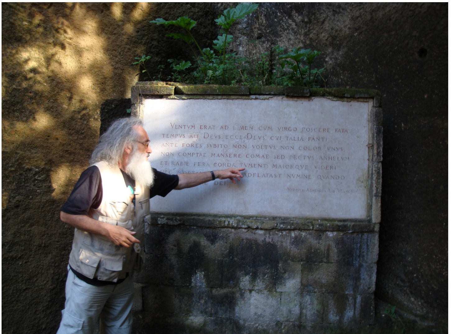
Devant l'autre de la Sibylle de Cumes, un professeur traduit à ses étudiants une inscription retranscrivant la description que Virgile fait de la prophétesse (Énéide VI, 45-50)

[...] [10] Septimam, Cumanam, [...] novem libros attulisse ad regem Tarquinius Priscum , ac pro eis trecentos Philippeos postulasse regemque aspernatum pretii magnitudinem derisisse mulieris insaniam : illam in conspectu regis tres combussisse ac pro reliquis idem pretium postulasse : Tarquinius multo magis mulierem insanire putasse. [11] Quae denuo tribus aliis exustis, cum in eodem pretio perseveraret, motum esse regem, ac residuos trecentis aureis emisse : quorum postea numerus sit auctus, Capitolio refecto, quod ex omnibus civitatibus et Italicis et Graecis [...] coacti allatique sunt Romam cujuscumque Sibyllae nomine fuerunt.