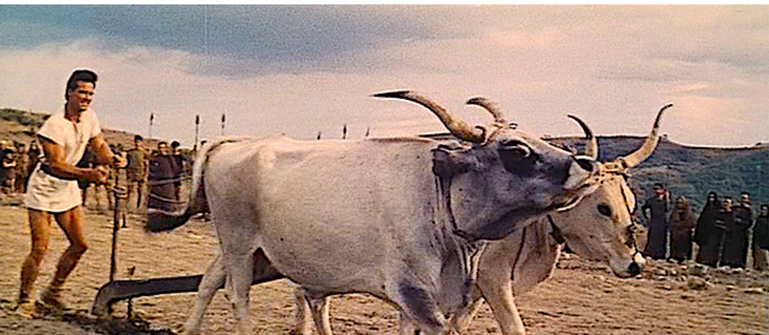
Romulus trace le sillon des murailles de Rome ( Romulus et Rémus , Sergio Corbucci, 1961)