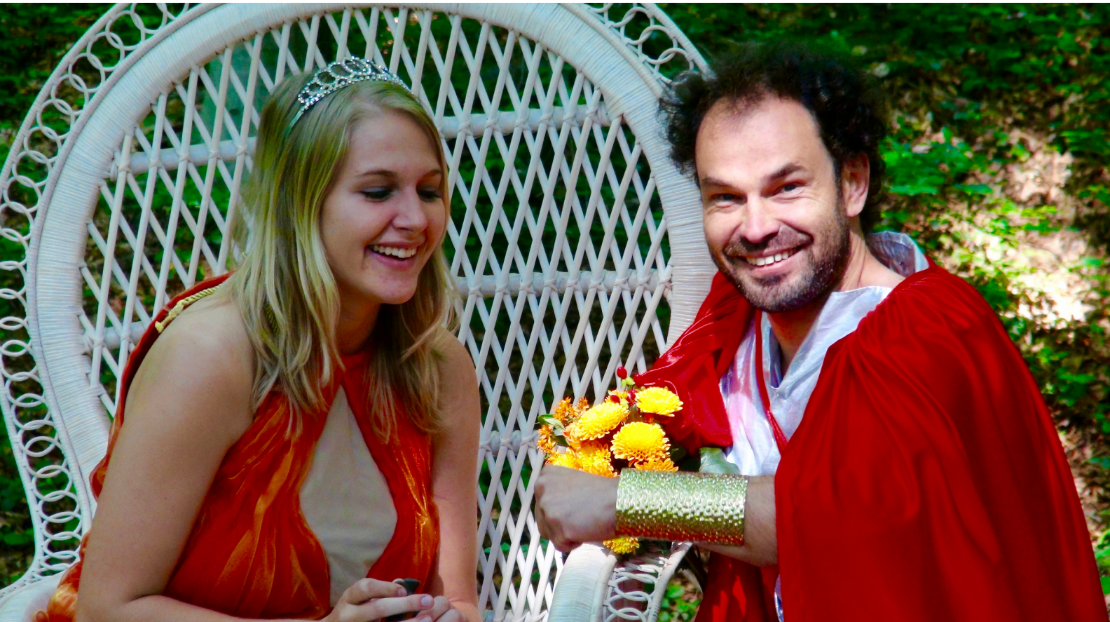
Vénus et Mars ( Curiosa Pandora , Claude Aubert, 2014)

est. [10] Quae prima, ut in Historia Sacra continetur, artem meretriciam instituit auctor que mulieribus in Cypro fuit uti vulgo corpore quaestum facerent : quod idcirco imperavit ne sola praeter alias mulieres impudica et virorum appetens videretur. [11] Etiamne habet haec aliquid numinis, cuius plura numerantur adulteria quam partus ?