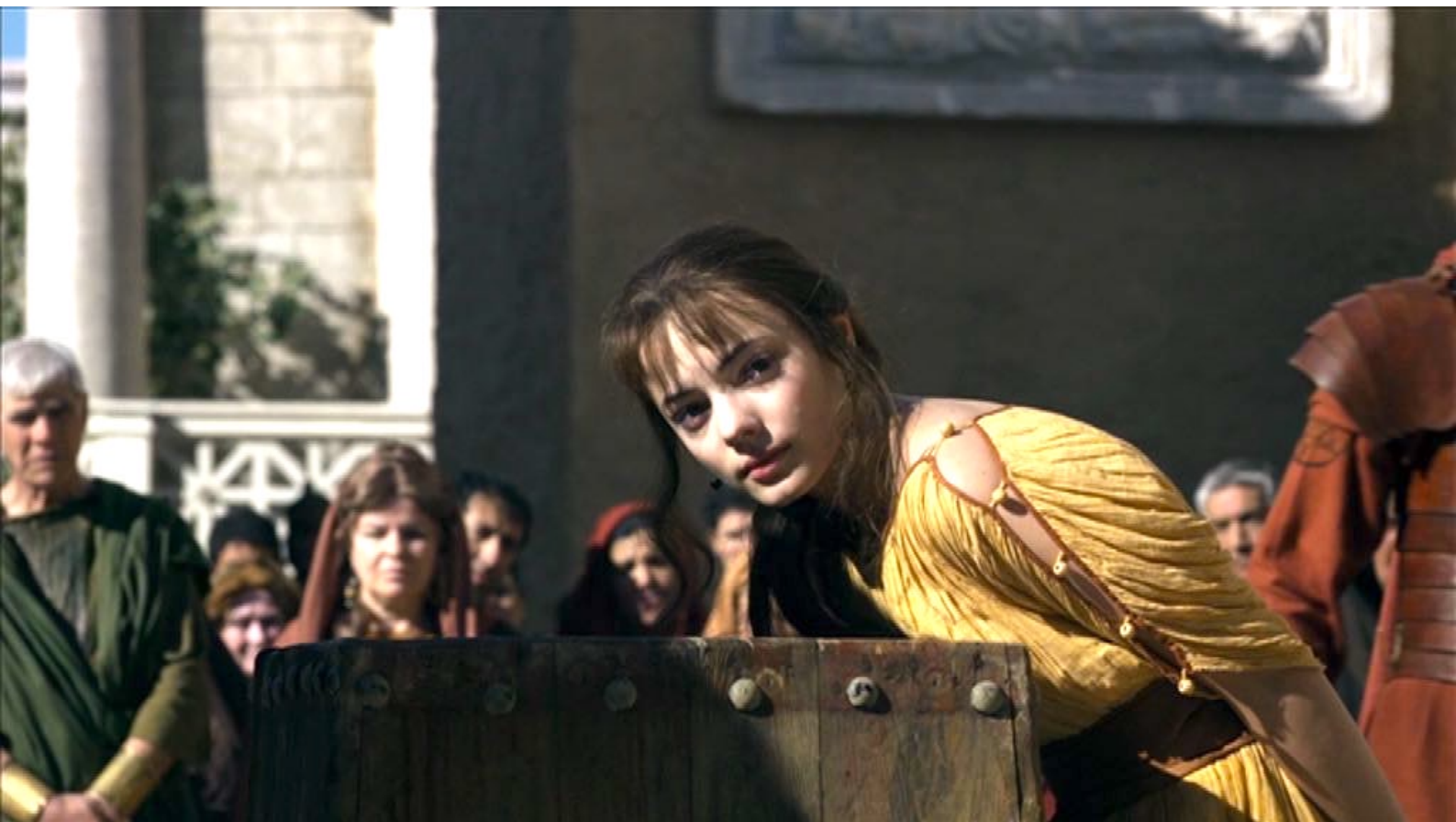
Santa Barbara : on la force à se pencher sur le billot,