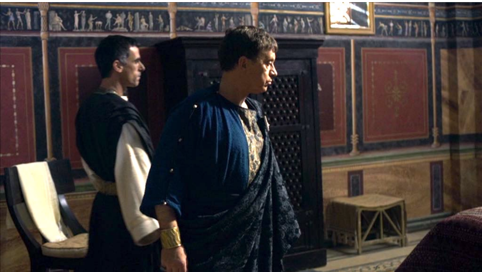
Santa Barbara : Entretiens Dioscore a trouvé vide la chambre de Barbara...