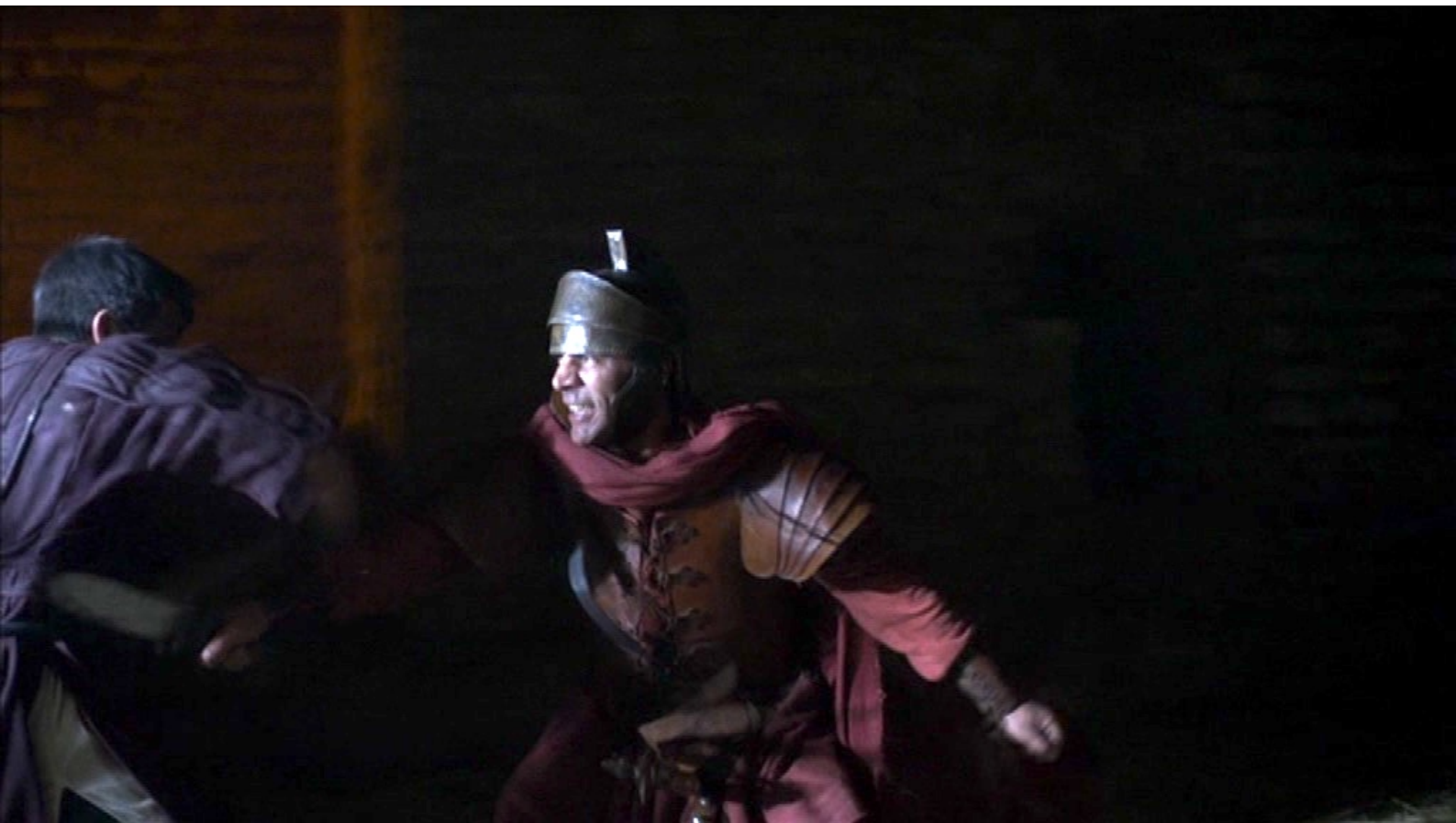
Santa Barbara : En cherchant à couvrir leur fuite, il est blessé par un des poursuivants,