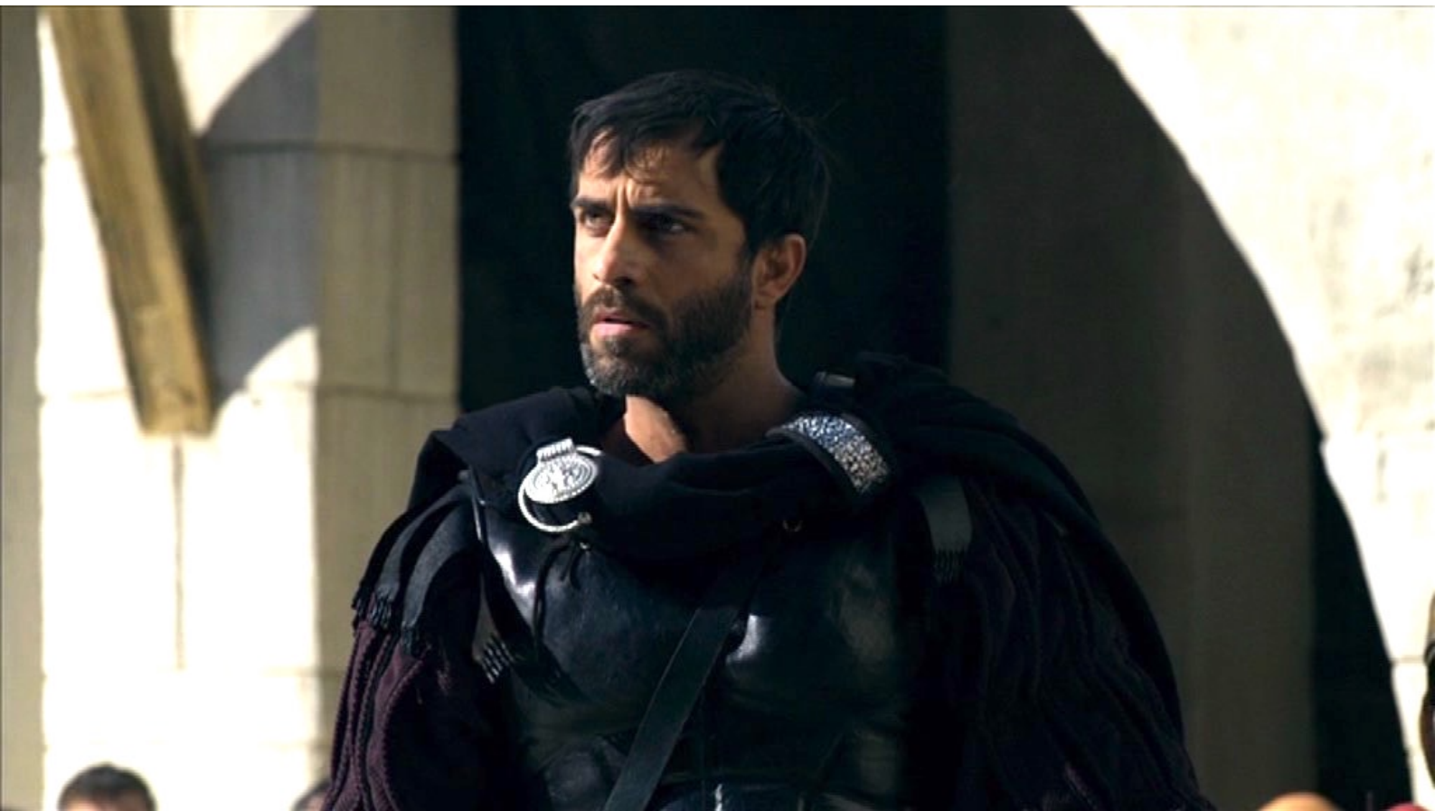
Santa Barbara : ... qu'il est un soldat et pas un bourreau, et Marcianus le fait emprisonner pour refus d'ordre.