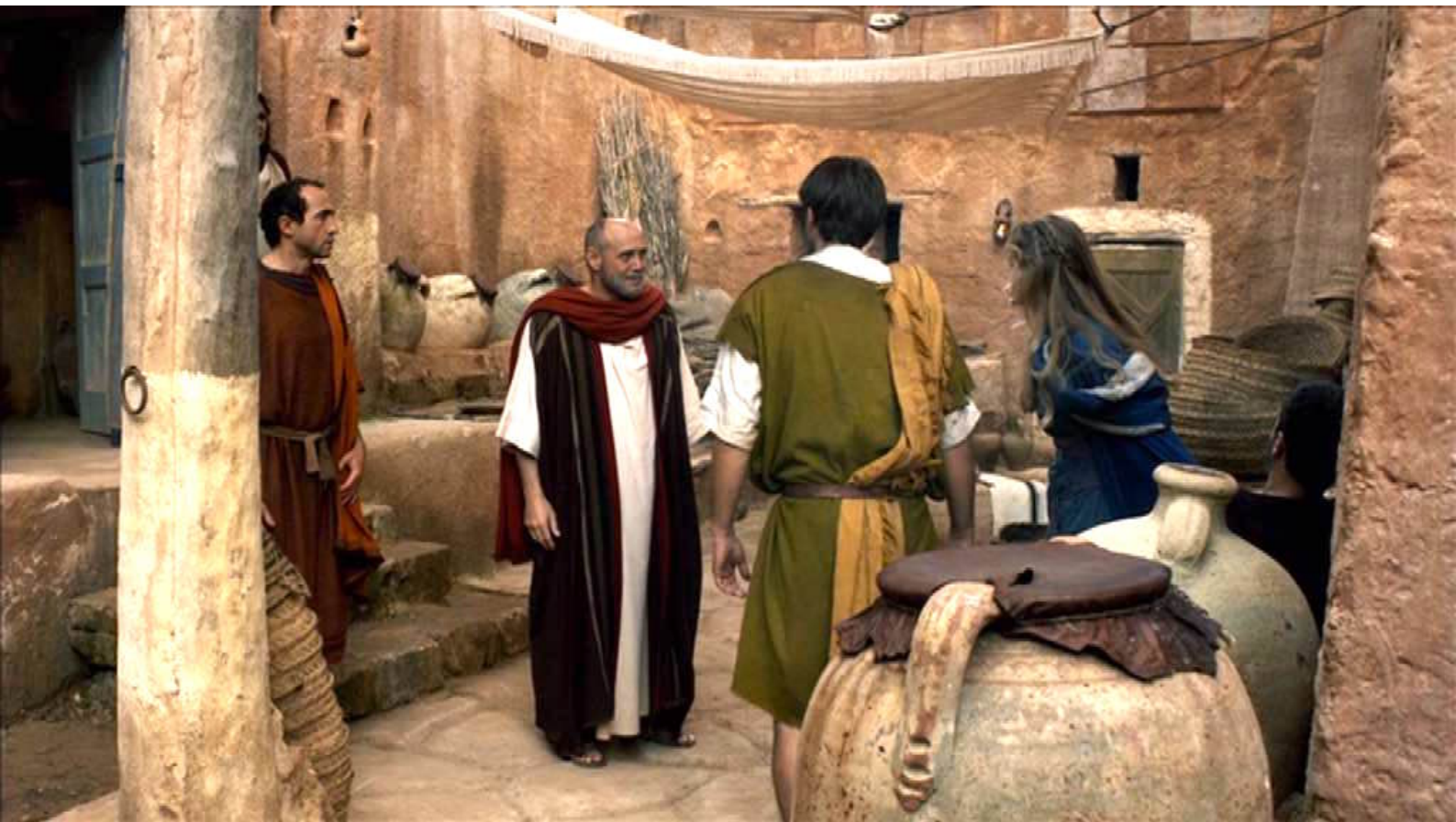
Santa Barbara : Néanmoins Marcellino sort...