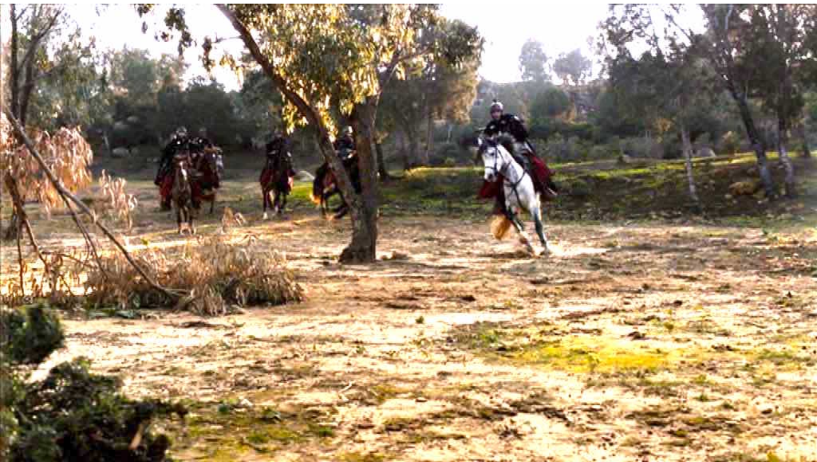
Santa Barbara : puis dans la campagne...