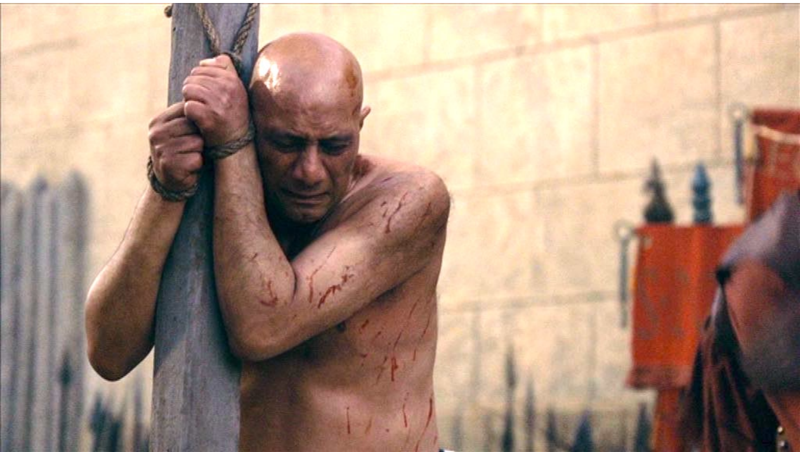
Santa Barbara : et il fait fouetter l'esclave responsable...