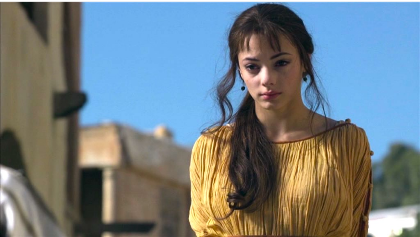
Santa Barbara : mais, comme elle persévère à refuser de reconnaître la nature divine de l'empereur,