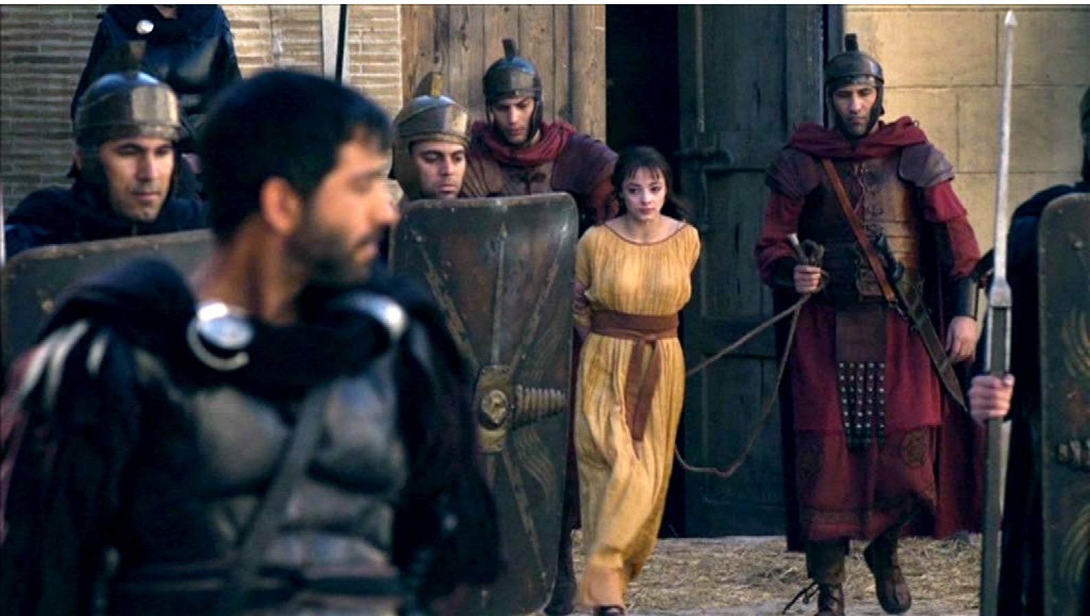
Santa Barbara : La condamnée est sortie de prison...