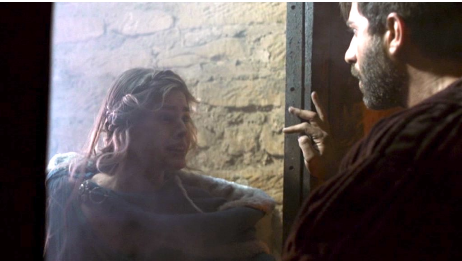
Santa Barbara : Au passage, Barbara libère Claudius, enfermé dans la cellule attenante,