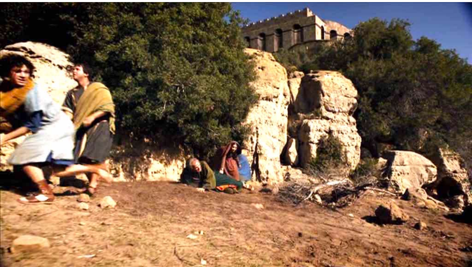
Santa Barbara : ... et cherchent à fuir le plus vite possible.