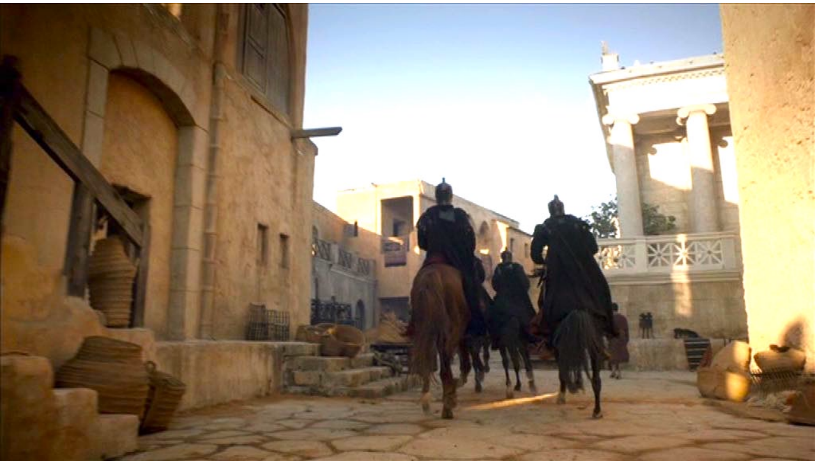
Santa Barbara : Cependant la poursuite commence dans la ville,