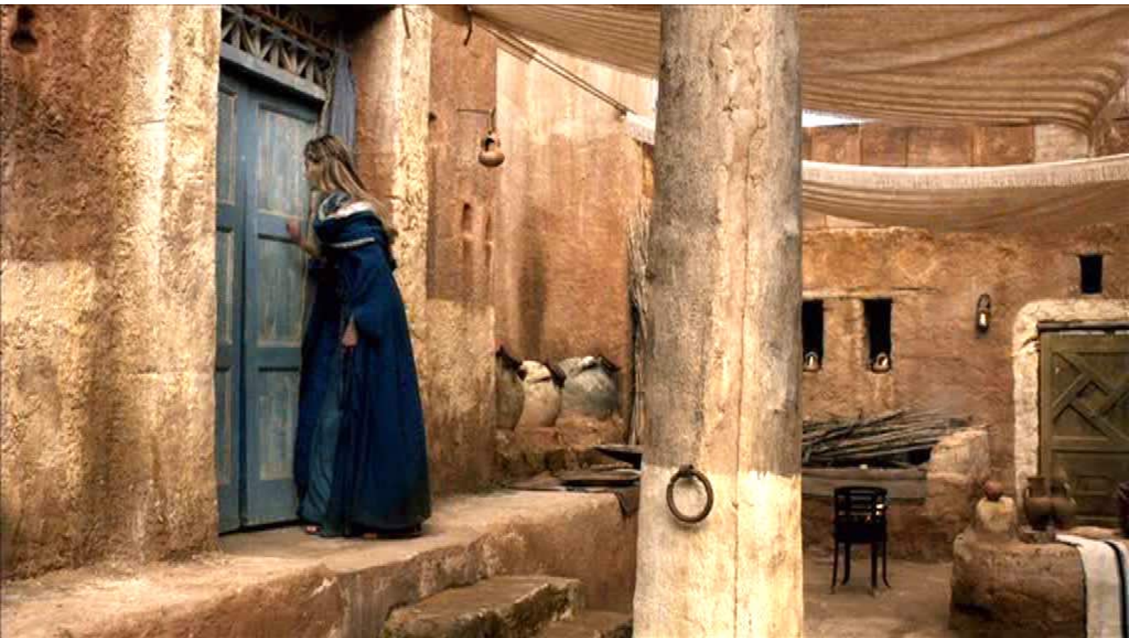
Santa Barbara : Arrivée devant la porte, Barbara frappe,