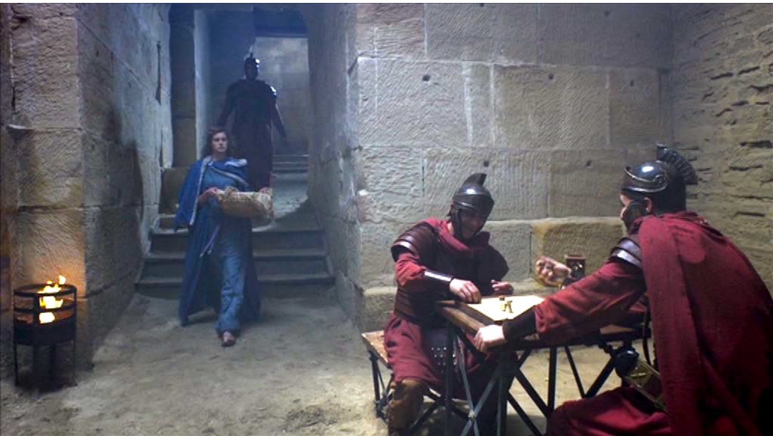
Santa Barbara : où les gardes, dupés, la laissent entrer auprès de ses amis chrétiens.