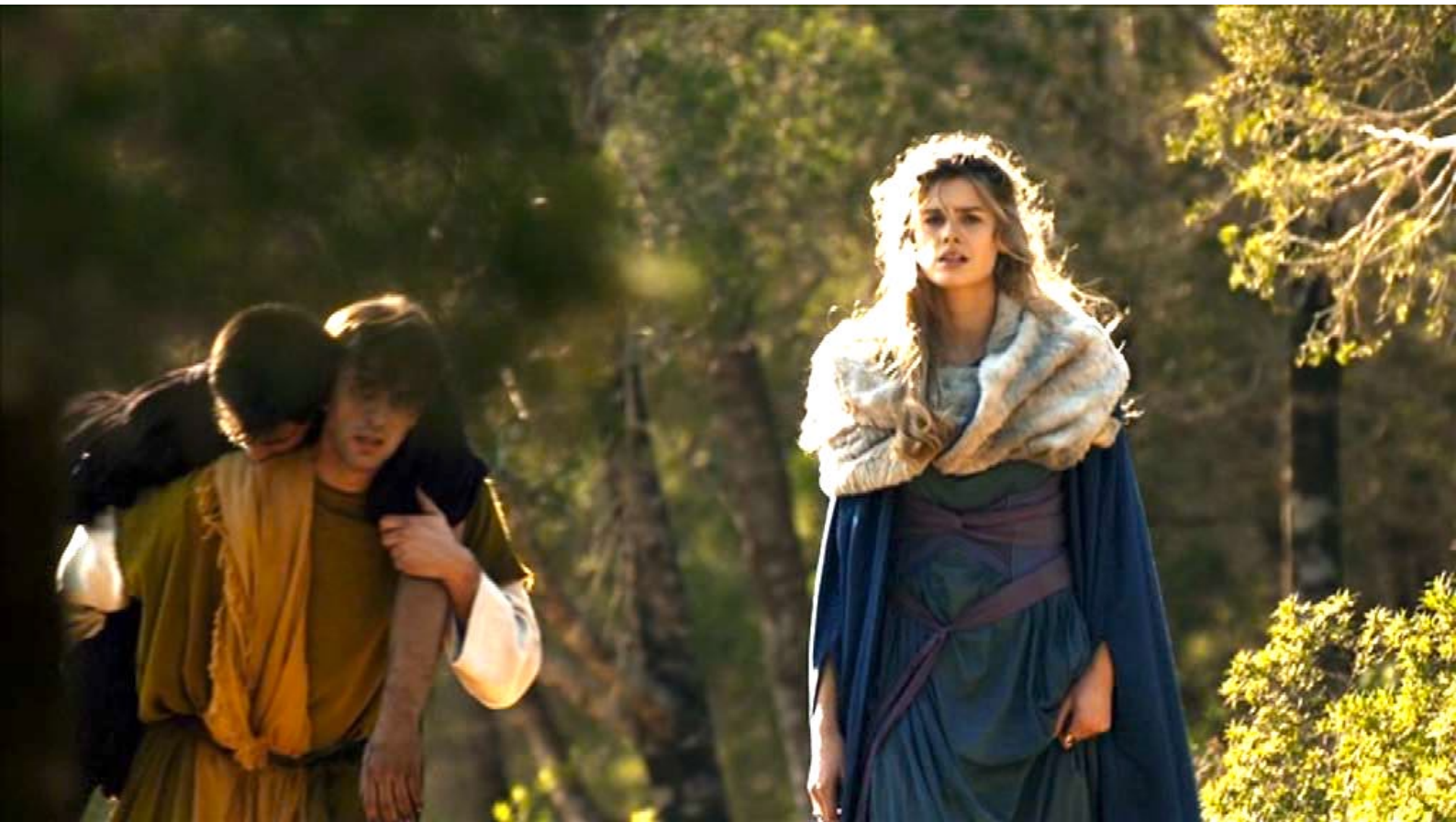
Santa Barbara : ce qui pousse Livius à le porter sur son dos dans la forêt.