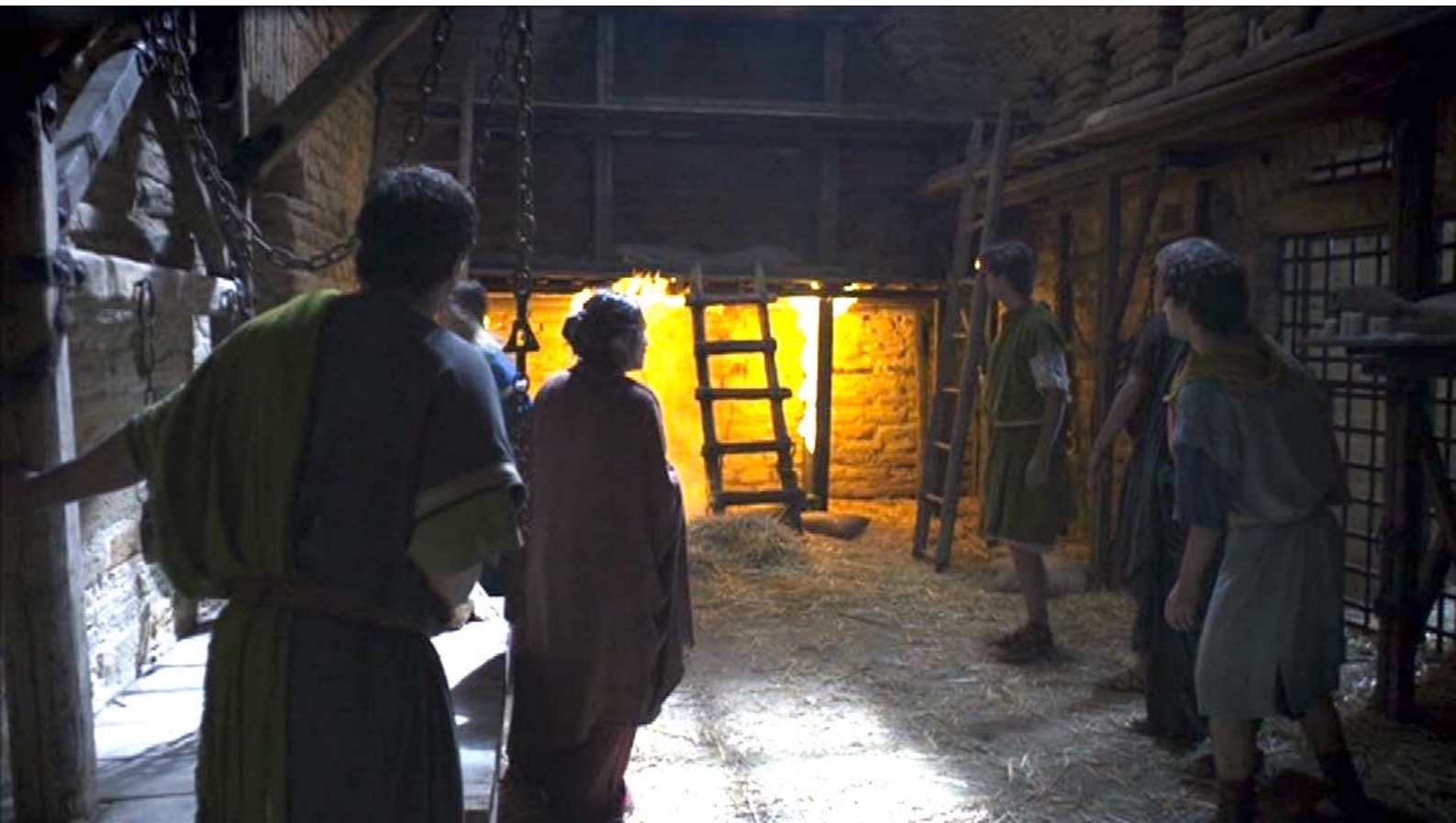
Santa Barbara : De son côté, pour faire diversion, Barbara met le feu dans la prison...