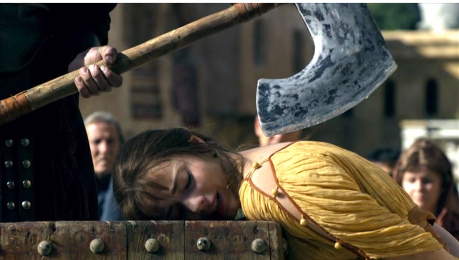
Santa Barbara : Cependant, au moment d'abattre la hache, il déclare...