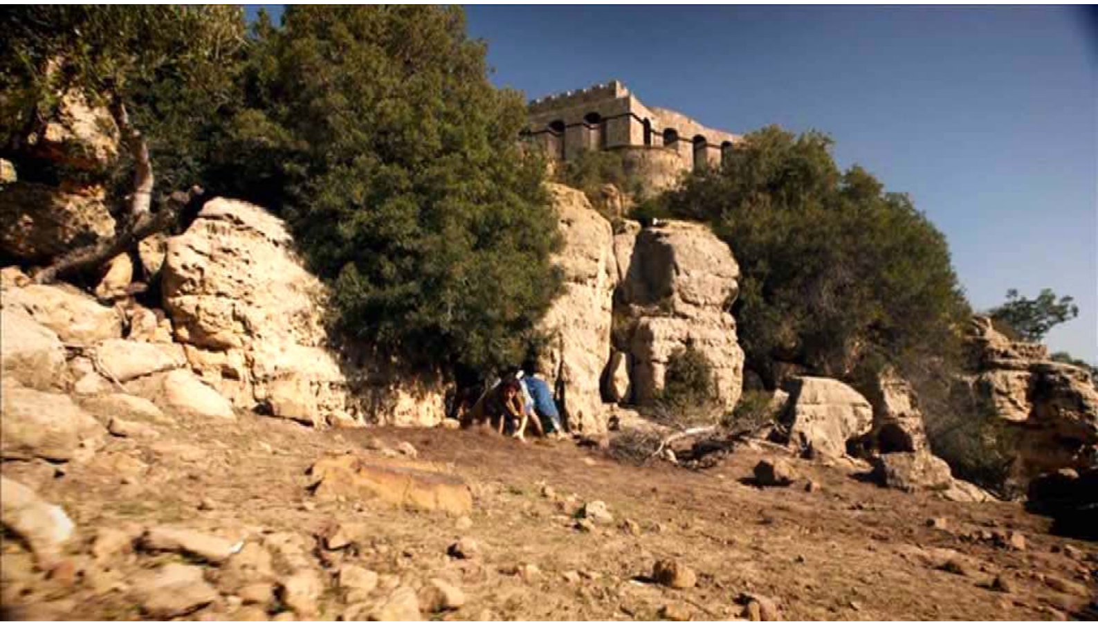
Santa Barbara : Finalement, les évadés trouvent la sortie...