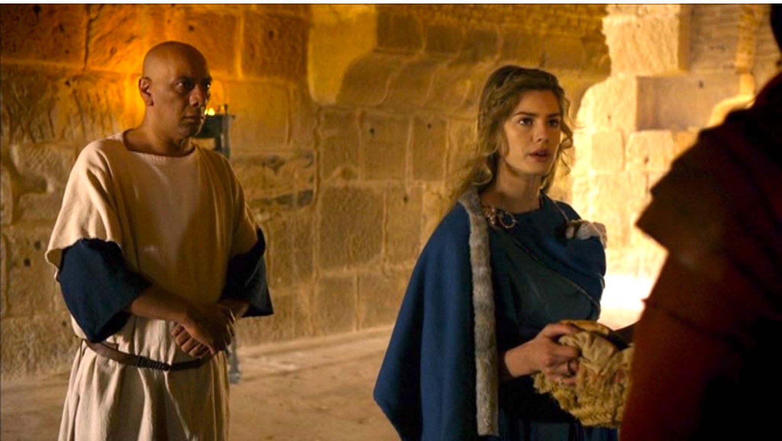
Santa Barbara : ... et qui accepte de l'accompagner à la prison,