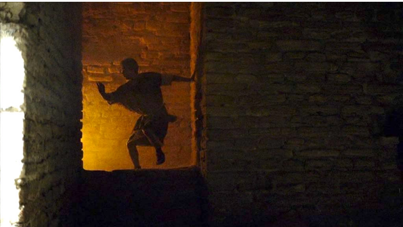
Santa Barbara : ... et, profitant de la panique, les prisonniers s'échappent.