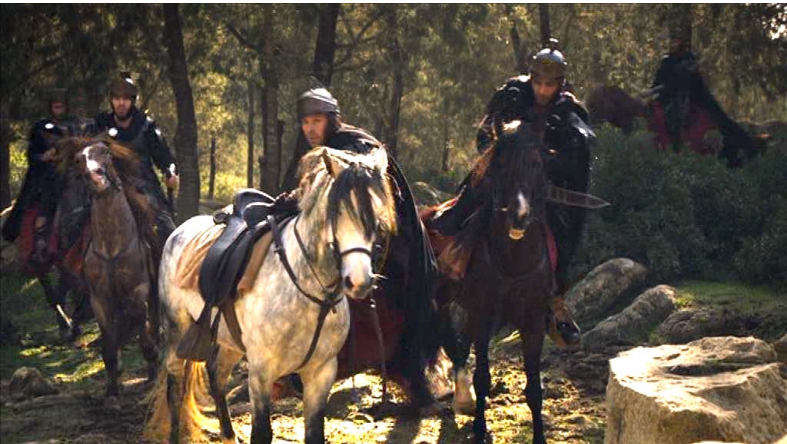
Santa Barbara : ... et dans les bois.