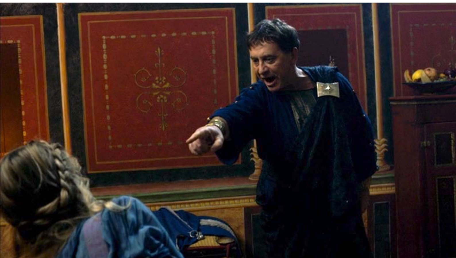
Santa Barbara : Quant à Dioscore, il confine dans sa chambre Barbara, qui sympathise trop avec les chrétiens.