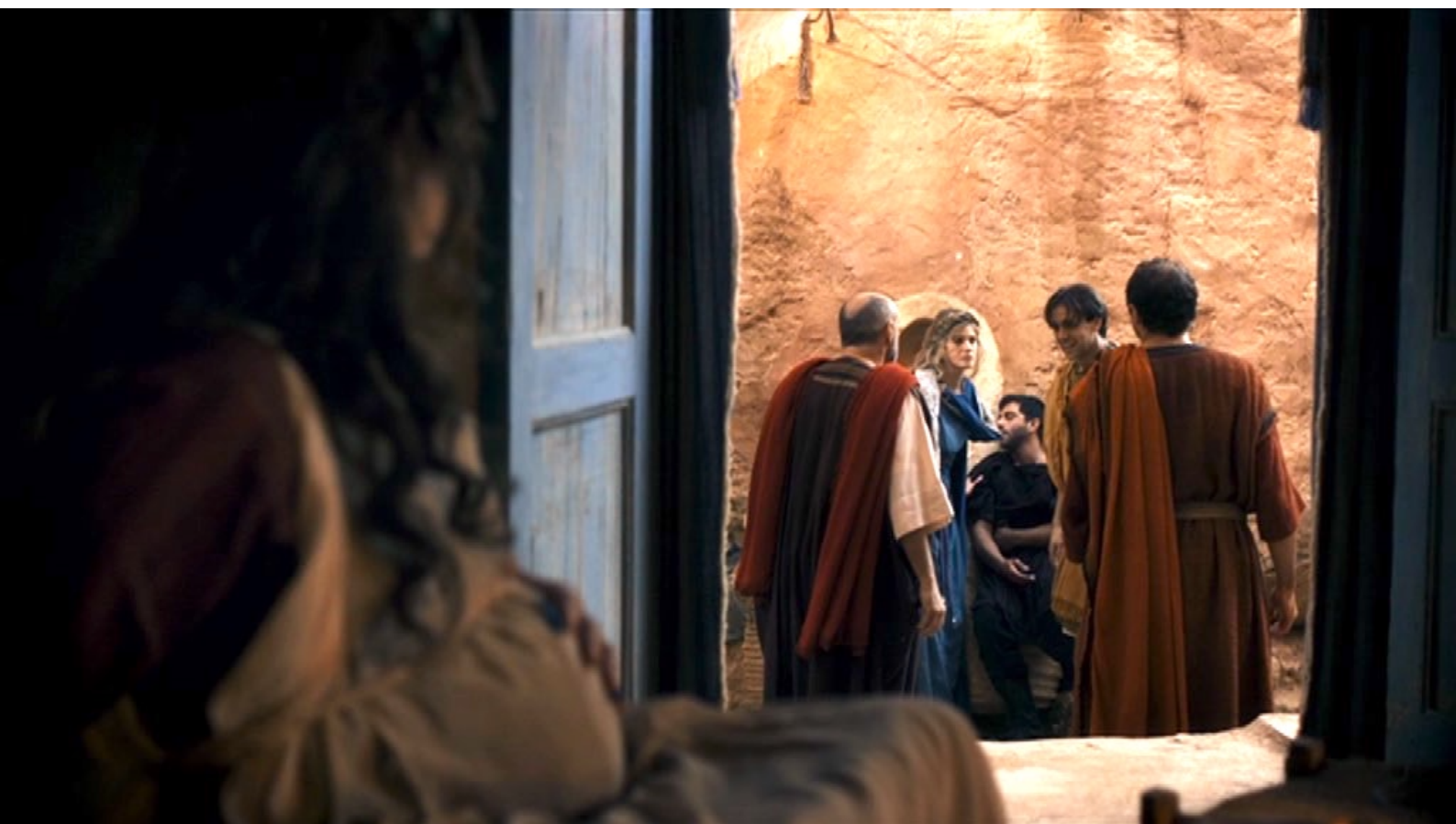
Santa Barbara : ... et, voyant Claudius blessé, décide d'accueillir les fugitifs.