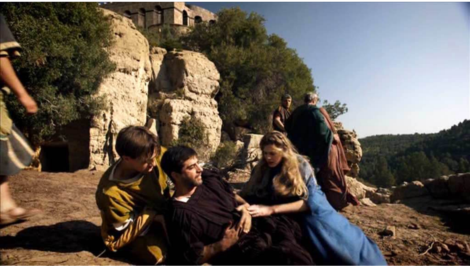
Santa Barbara : Cependant Claudius, gravement blessé, ne peut plus marcher,