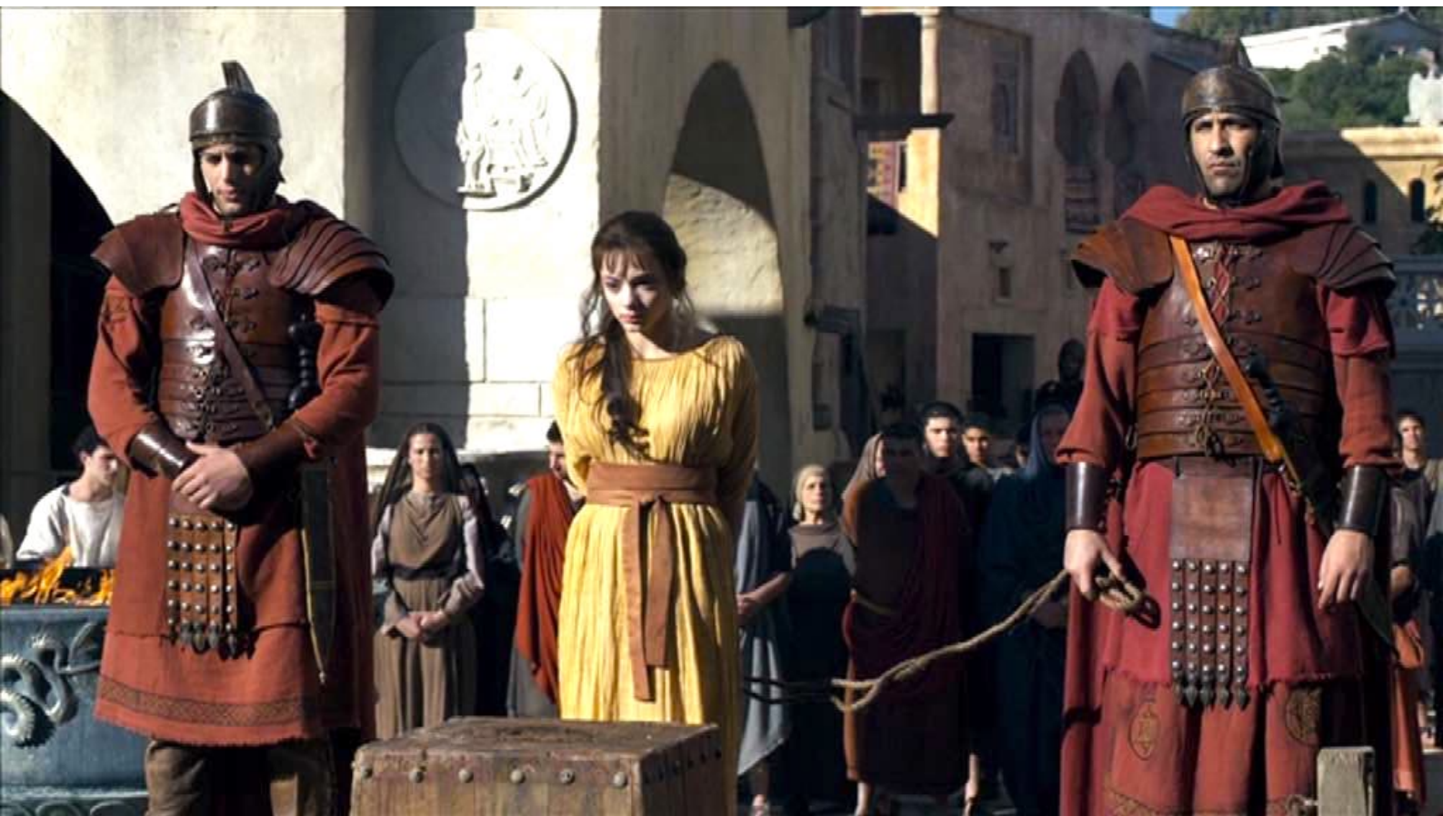
Santa Barbara : ... et amenée devant le billot,