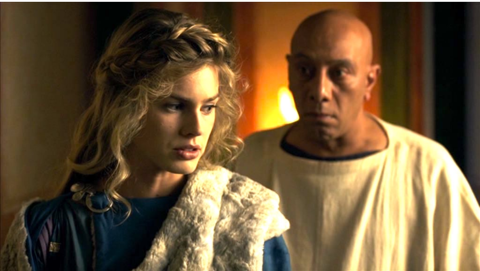
Santa Barbara : Mais elle circonviert l'esclave qui devait la surveiller...