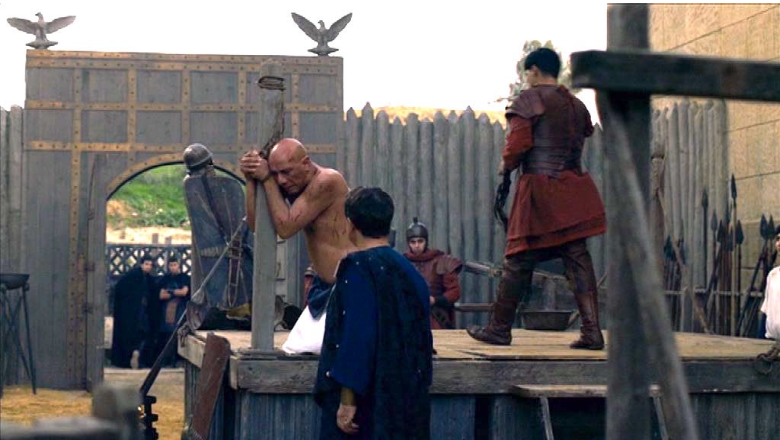
Santa Barbara : douloureusement en public pour l'exemple.