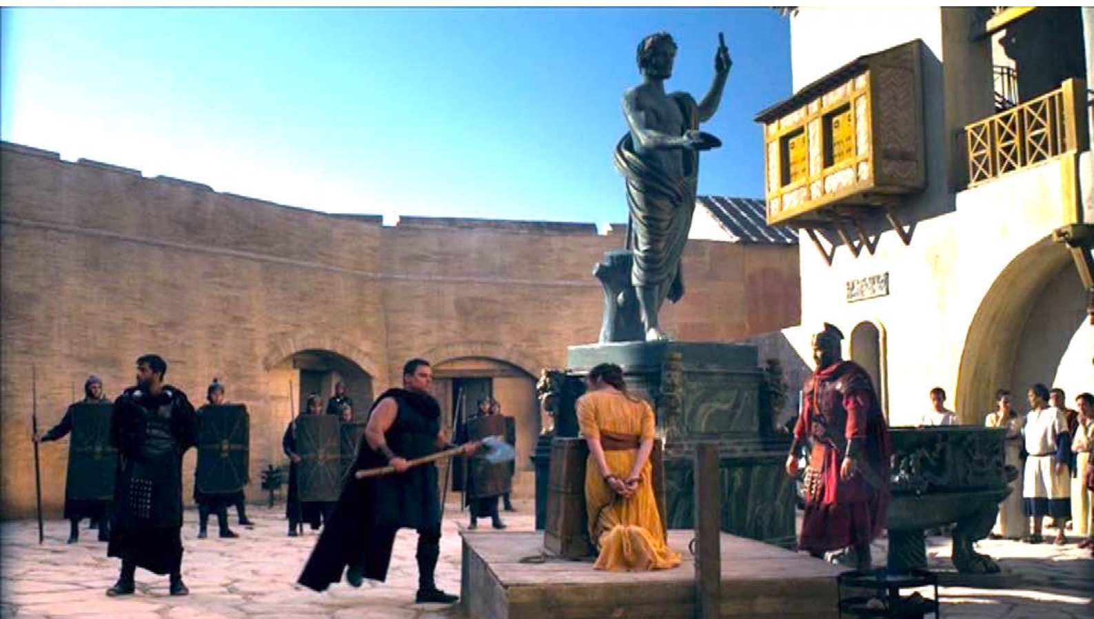
Santa Barbara : Puis le vrai bourreau s'approche...