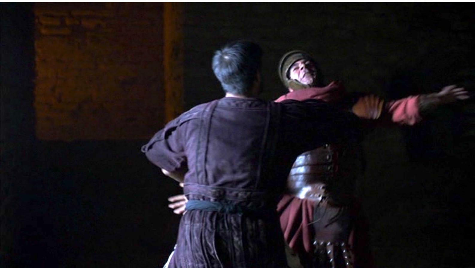
Santa Barbara : ... mais réussit à le tuer.