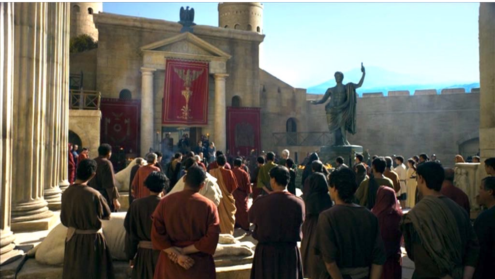
Santa Barbara : Sur la place publique, une foule attend l'exécution de Julienne.

Comme deuxième portfolio du numéro 48 de La 12 e Heure , nous vous offrons dans la présente annexe un petit florilège de photos tirées de la suite du film Santa Barbara de Carmine Elia, dont nous avons parlé dans notre rubrique "Nouvelles Acquisitions".