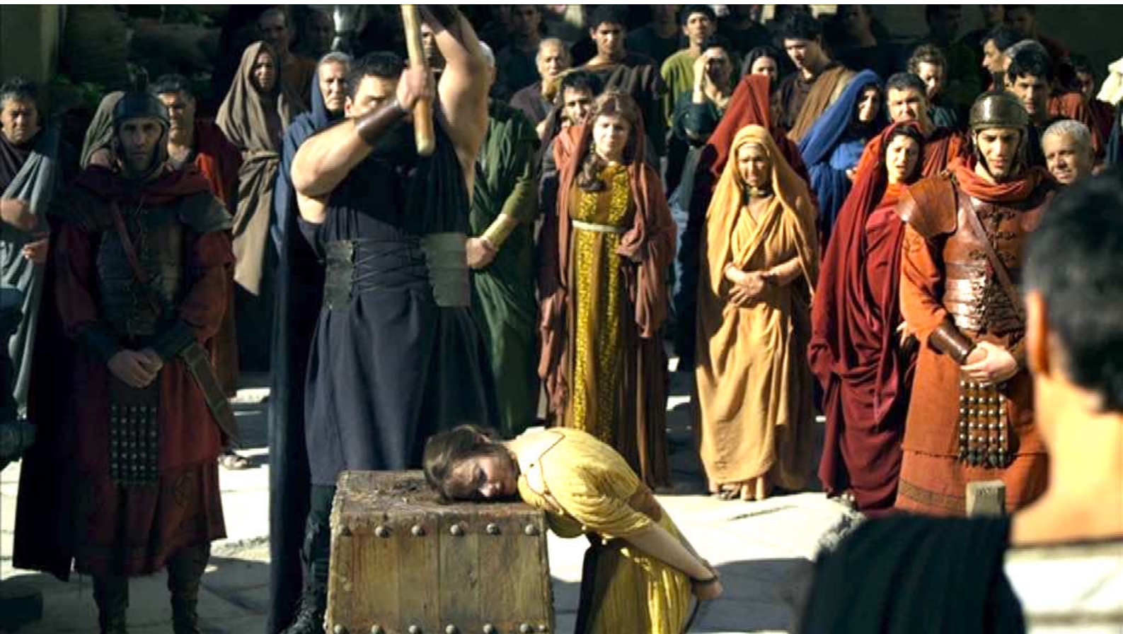
Santa Barbara : ... et décapite la martyre.